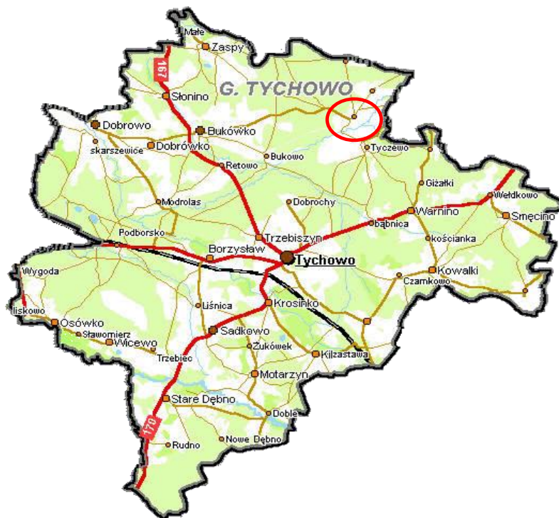
Rysunek Nr 1. Położenie miejscowości w gminie.